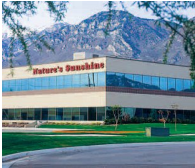
Hlavní sídlo spol. Nature's Sunshine v Provo, Utah, USA

Synergy/NSP bude otvírat český trh! Neváhejte a buďte u toho od samého začátku!