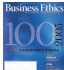
37.místo mezi nejetichtějšími společnostmi v USA.