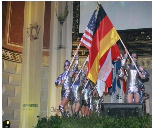
Synergy WorldWide Slavnostní otevření trhu v Německu, červen 2008 Láznešský dům ve Wiesbadenu

Entrepreneur: 8.místo v "Top 100" nejrychleji rostoucích společností Forbes: v „Top 100“ nejlepších firem Výrobce roku nutričních produktů 37.místo mezi nejetichtějšími společnostmi Nárůst obrátu o 1.500% ve 2,5 letech Synergy vyplácí na provizích 55% - to je nejvyšší sazba v průmyslu Synergy otevřela 15 mezinárodních trhů během 5 roků Synergy má strategii globální expanze – plánuje otevření 70 mezinárodních trhů v příštích 15-ti až 20-ti letech Připravuje tu nejagresivnější periodu růstu v historii SuccessSystem startuje v lednu 2009 se zacílením na ČR a Španělsko!