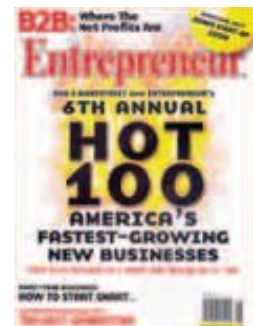
8.místo mezi nejrychleji rostoucími firmami v USA