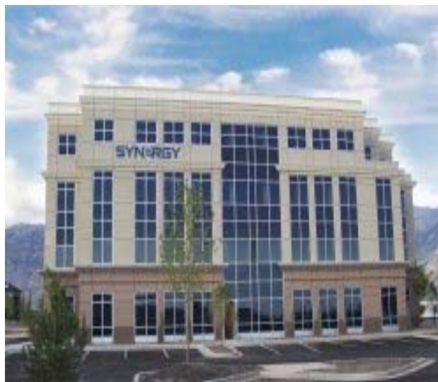
Hlavní sídlo spol. Synergy WorldWide, Utah, USA